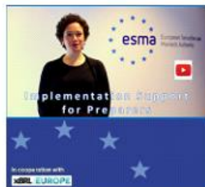
Implementation support for Preparers by ESMA