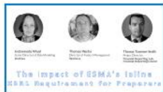
The Impact of ESMA's inline XBRL Requirements by Workiva