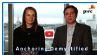
Anchoring Demystified by PwC UK