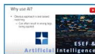
ESEF & Artificial Intelligence By CoreFiling