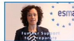
Further support for Preparers by ESMA