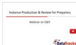
Instance Production & Review for Preparers by DataTracks